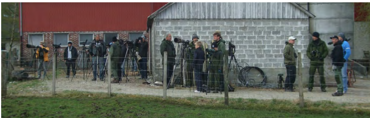
Tilreisende fra mesteparten av sør-Rogaland

er blitt sett på Oremo. Åtselgribben tok seg noen flyturer utover dagen til stor glede for kikkene. Flere fikk tatt gode blinkskudd av fuglen.