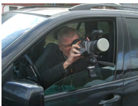
Noen glemte å ta av dekkelet

Mandag morgen var fuglekikkerne på plass igjen og fulgte åtselgribben utover dagen. Den tok noen flyturer inn i mellom, men satte seg oppe i fjellveggen under Såta til langt på kveld. En av kikkene overnattet i bilen, og var oppe tidlig tirsdag for å se etter fuglen – men da var den føyet. Og så var denne historien til endes. Besøket varte fra lørdag den 8.mai til mandag den 10.mai 2010. Det hadde da vært ca 60 biler på Oremo, som stod utette vegen, til helt utenfor Trygve sin hage.