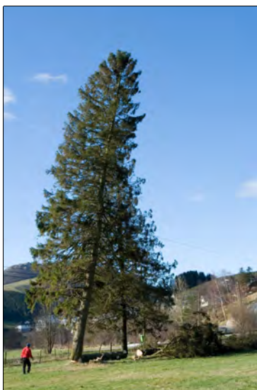
Her forsvinn siste rest frå den gamle skulen.