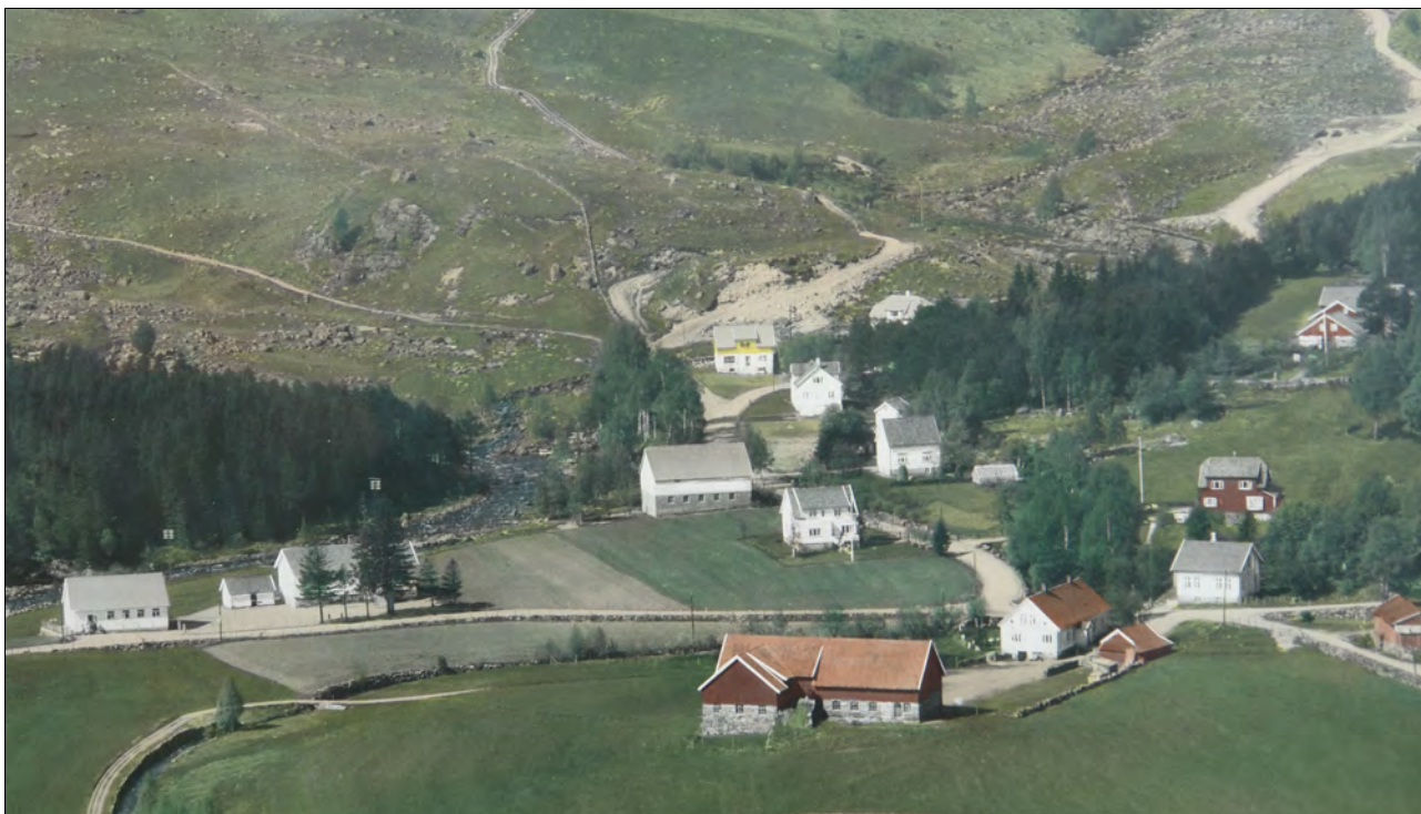
Skulen med dei store grantrea, bedehuset heilt t.v.