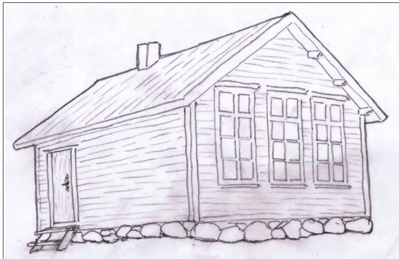
Skulehuset på Netland.