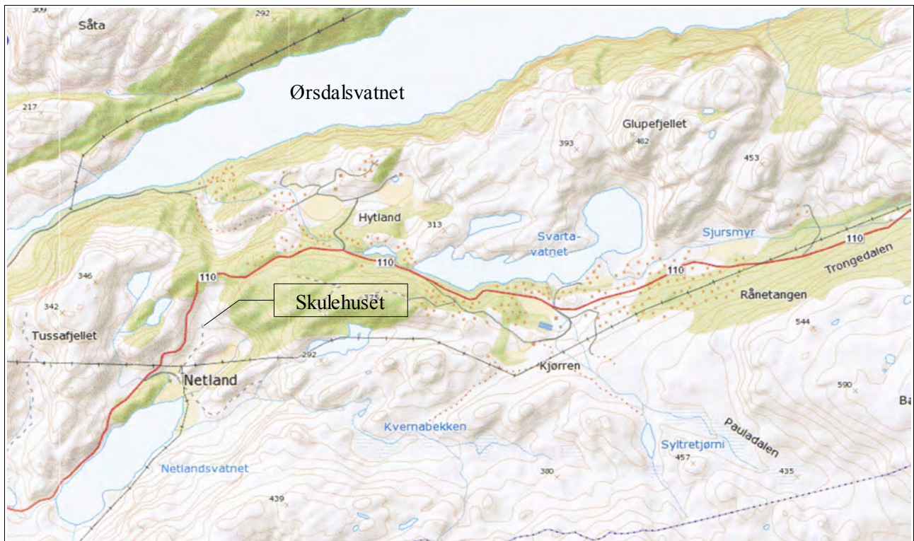
Skulehuset stod nede i dalen nord fra gården Netland. Her kan en fremdeles sjå grunnmuren. Skulen vart bygd før 1902 og nedlagt i 1931.