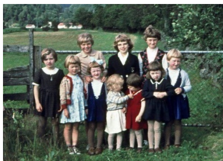
Apeland jenter ca. 1956-66.