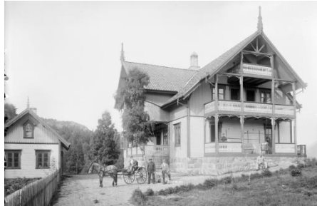
Sportsheim på Fjermedal. Begge foto Peter A. Flak 1896.