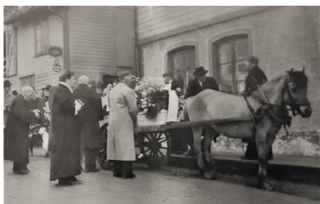
Gravferda til Elseberg Vinningland 1945.