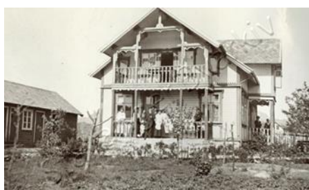
Sportshotellet som senere ble sanatorie.