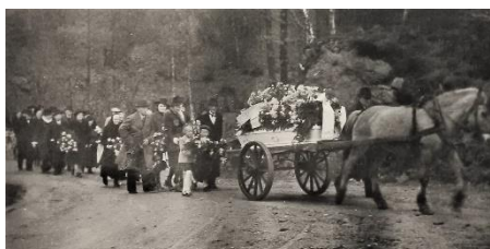
Gravfølget på veg til Bjerkreimskirken.