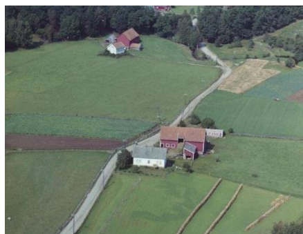
Fjermedal med garden til Rasman Fjermedal i bakgrunnen.