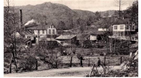
Fjermedal ca. 1919.