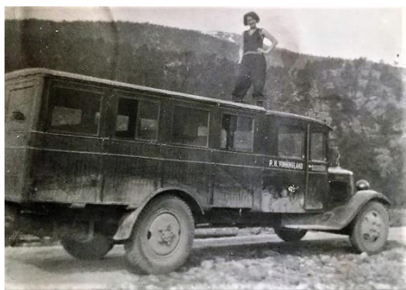
Samme bil ombygget til buss.