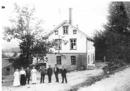
Ysteriet på Fjermedal med betjeningen framfor.