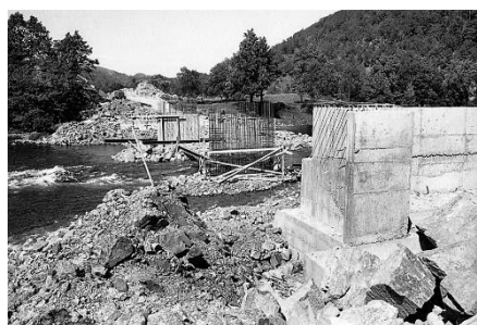
Bjerkreimbrua over elva for den nye E39 ca.1970.