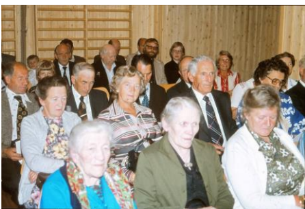
Mange kjente bjerkreimsbuer.