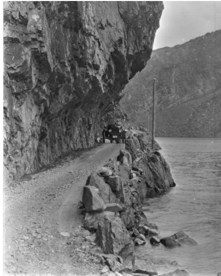
Vegen langs Håfreiste. ca. 1920.