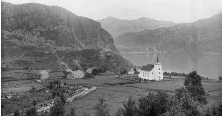
Ivesdal ca. 1895.

Nye bilder legges ut fortløpende, så følg med!