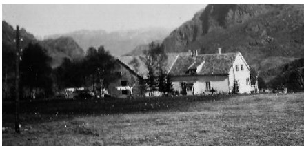
Høgevoll på Nedrebø 1946.

Nye bilder legges ut fortløpende, så følg med!