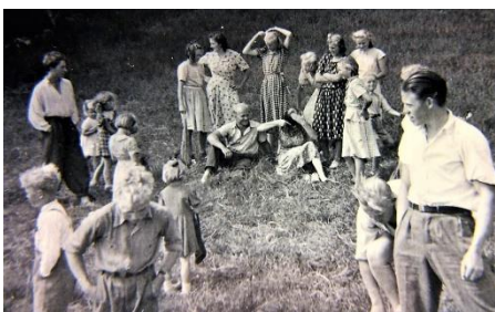
Søndag på Høgevoll.