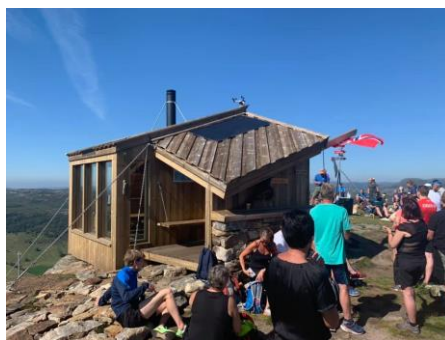
Åpning av gapahuken på Storafjell i 2020.