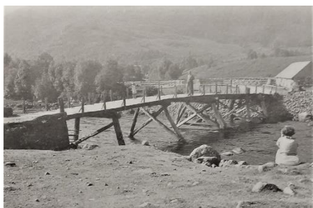
Vikesdalsbrua i 1937.