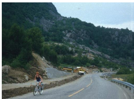
Vikesdalslia 1985.