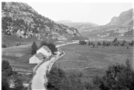
Husmannsplassen Larsastykket 1896.