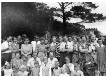
Familietreff på Vikesdal i 1952.