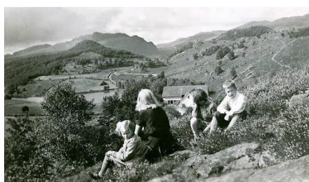
Utsikt mot Vikesdalslia. Her har det blitt store forandringer.