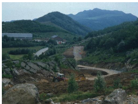
Starten på opparbeiding av boligfeltet i Vikesdalslia 1985