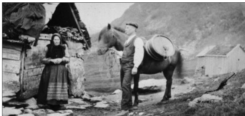
Ein handelsmann på besøk hjå ei gamal gardakone.

Omgangshandel med finere tøystoff – de såkalte kråmkarer drog fra sted til sted med sine varer. Denne handelen har røtter langt tilbake. Men andre varer som her er nevnt; som brynesteiner fra Eidsborg i Telemark, skinnvarer, jernvarer som jær, humle, salt, tobakk, nåler og andre småvarer vart også omsatt omkring i bygdene. Varene bar de på ryggen i en sekk, eller de lastet varene opp på hesteryggen når børa var tung og avstanden stor. Slike handelsmenn opparbeidet seg gode kontakter hvor de fikk kjøpt varene og hvor de senere fikk solgt dem. Og hadde de i tillegg god salgsteft, så gikk handelen godt. Den kunne gå i arv gjennom flere ledd – fra far til sønn.