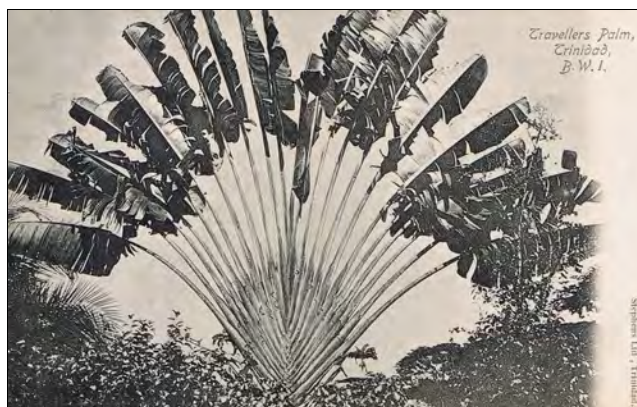
Bilde av «Reisendes palme» fra Trinidad, en sjømanns hilsen hjem.

Lengste turen i sjøen var då me gjekk frå New Guinea til New Orleans. Då var me berre innum Port of Spain på Trinidad og bunkra. Derifrå varde reisi 9 - 10 dagar, for skipet gjorde ikkje meir enn snaut 9 knop.