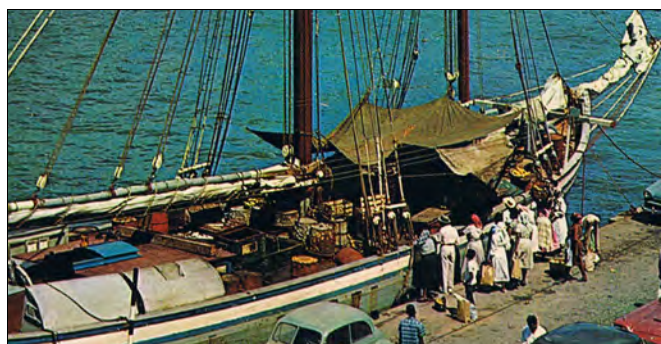
Havnebilde fra Curacao