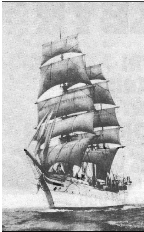
«Statsråd Lehmkuhl» i Nordsjøen for fulle segl i 1927

Då våren kom hadde eg søkt og fenge plass på skuleskipet "Statsråd Lehmkuhl" i Bergen, som matroselev. Når ein hadde fullført eit kurs her var ein hjelpt. Skuleskipstyret, som var samansett av skipsreiarar, syrgde for det.