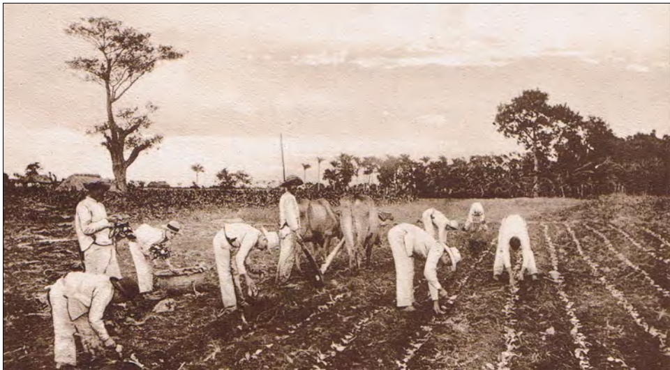
Tobakkplanting på Cuba slik det da var, med treplog og oksespann.

Det tok ikkje meir enn ein dag å lasta skipet med den tunge, raude bauxit-grusen. Det rauk ufyseleg under lastingi. Det raude støvet la seg yver heile skipet både innvendig og utvendig. Me trong heile dagen til å vaska og spyla det burt på ferdi ut mot sjøen.