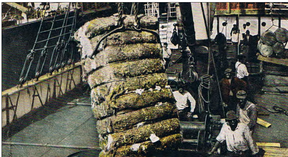
Lasting av bomull på steambåt for eksport.