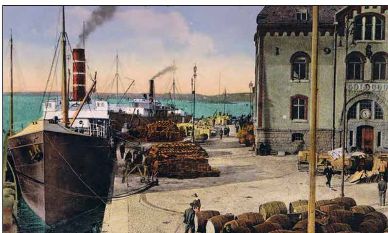
Parti fra Tollbodkaia i Stavanger, det nærmeste Egil Bjarne kunne komme utenriksfart.