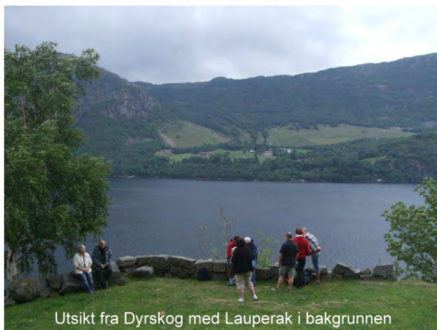
Utsikt fra Dyrskog med Lauperak i bakgrunnen