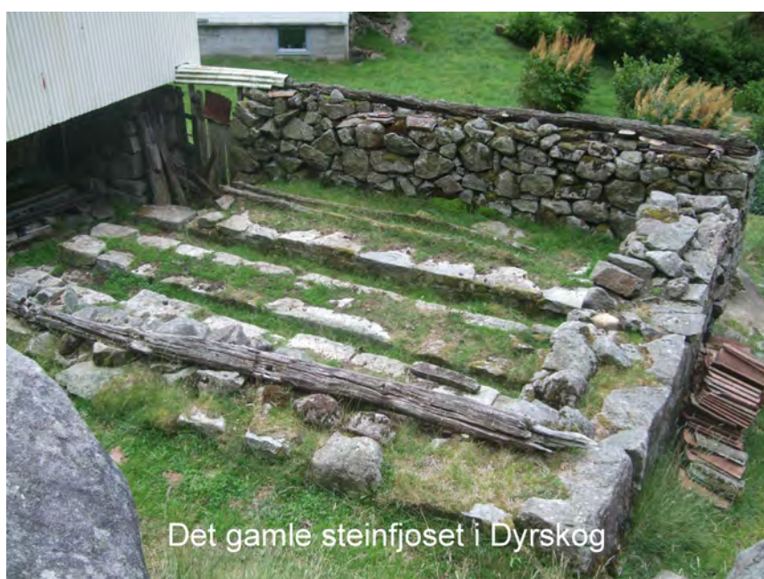
Det gamle steinfjoseet i Dyrskog