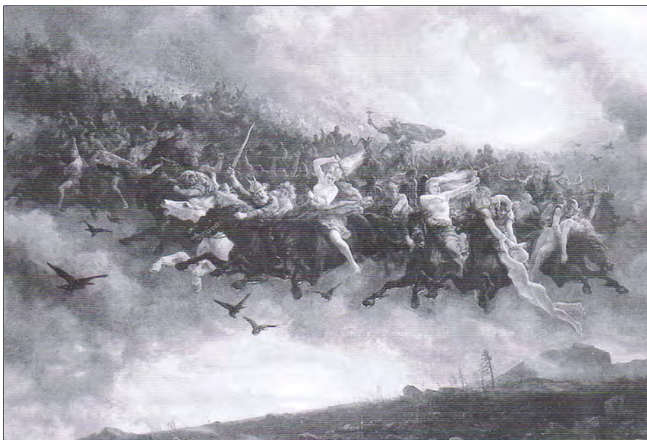
«Åsgårdsreien», maleri av Peter Arbo fra 1872. Nasjonalgalleriet i Oslo

Jul er den einaste kyrkjelege høgtida som har si rot i heitenskapen. I den tida trudde dei på Odin og Tor, då hadde folk alt lært å bryggja øl. Og når ølet svævde dei inn, så var det ei gåva frå gudane, det var ein gudedrikk, sa dei.