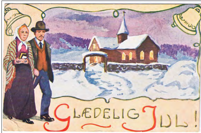
Kort nr.14, brukt 1921