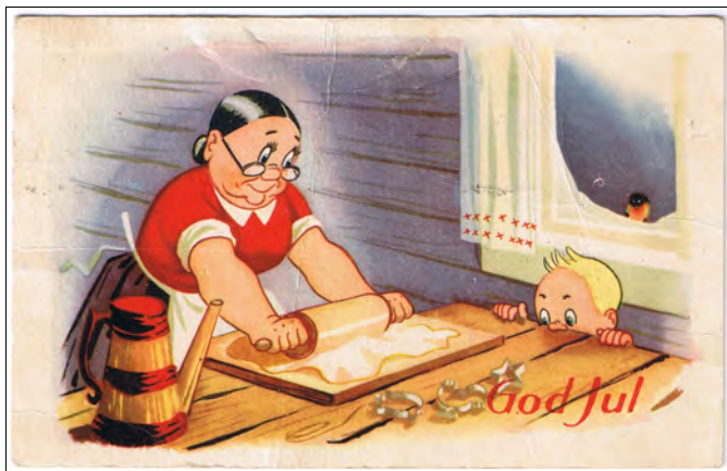
Kort nr.15, brukt 1947