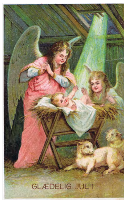
Kort nr.13, brukt 1919