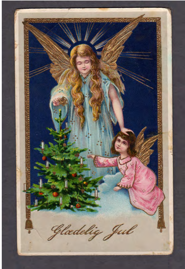
Julekort fra 1913 (kort nr.1)