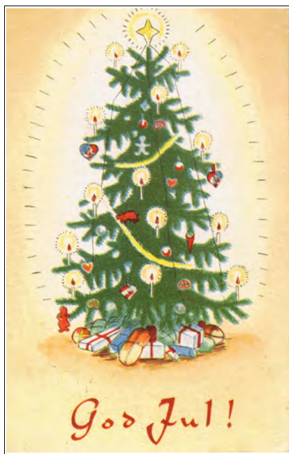
Kort nr.19, brukt 1942