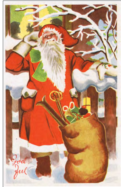
Kort nr.17, brukt 1950