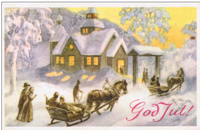
Kort nr.16, brukt 1954