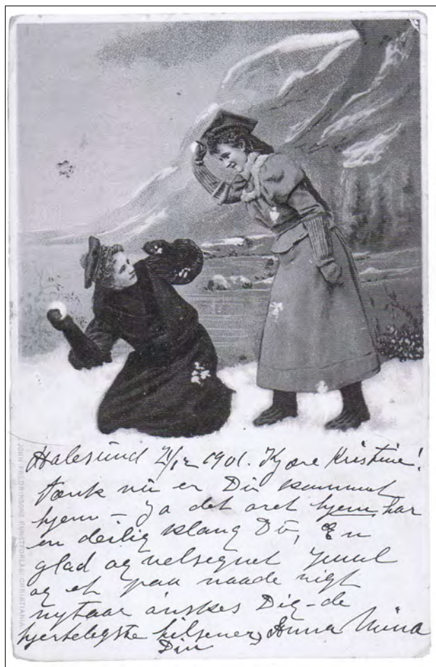
Her ser vi et postkort fra 1901 med julehilsen (kilde 5).

I alle heimar, både i kristelege og mer verdslege heimar song dei julesalmar or Kingo salmebok og far las juleevangeliet. Då måtte borna sitja stille. Og så kom det gillaste. Då fekk dei julegåvene, alt var nyttige ting, nye klede, sokkar, vottar, treskor, treskeier, knivar og mykje anna, neter (nøtter), søteple og gode kaker.