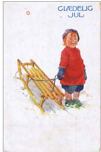
Kort nr.18, brukt 1920