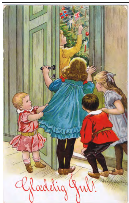
Kort nr.12, brukt 1919