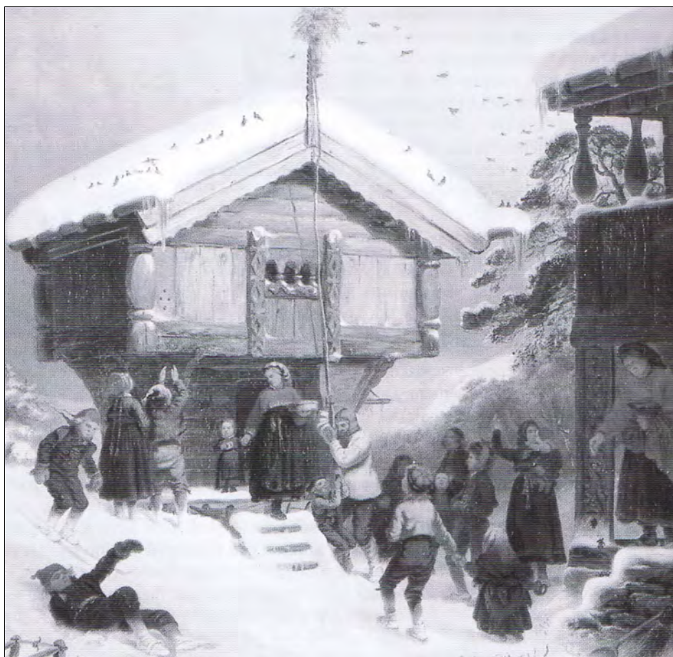
«Juleskikker», maleri av Adolf Tidemann fra 1846. Nasjonalgalleriet i Oslo.

Den siste søndagen føre jul var svartesøndag. Då gjekk dei i skitne kvardagsklede og åt dårleg kvardagsmat.