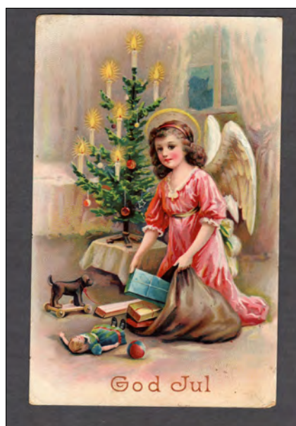
Julekort med engler var populære motiv.