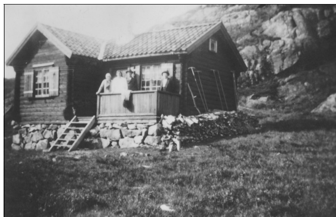
Hytta sett fra sør, like etter krigsåra.