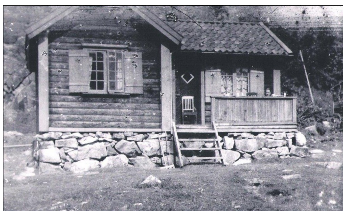
Hytta i Vaule dalen sommeren 1944.