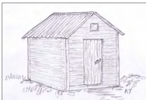
Hytta var et lite krypinn på 2 x 2,5 meter uten vindu, men det må ihvertfall ha vært en liten glas-glugg under mønet.

Våknet av rypeskrik i 6-tida. Her svært varmt og godt. Skodd og lit småregn. Ut og såg til garnet, men fikk aldrig en fisk. Kaffe, brød og 1 kall aure til frukost. Skal treffe N. i søre ende av vannet i 12 tida. Har vert i søre enden av van og traff N. Han kom med proviant og forskjellig til hytta. (Hytta låg på nordside av Storavatnet ovanfor Bjordal.)