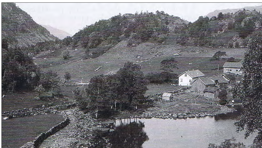
Berland sett fra øst med tjørna i framgrunnen. Det er den gamle ferdavegen til Skåredalen og Ørsdalsvatnet som går t.v. på bildet.

Eg og S. tok ut på tur i 9-tiden i gårkveld, veiret var utmerket med fint måneskin. Var på x (Berland) fikk tak i en av våre. Fikk greie på litt av hvert angående folkene. Fikk tak i en del proviant og avtalte å komme tilbake onsdag i ti tiden for å hente mer.