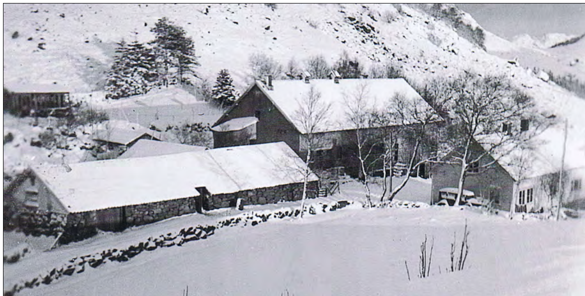
Dette er nabo-gardstunet slik det såg ut i 1944.