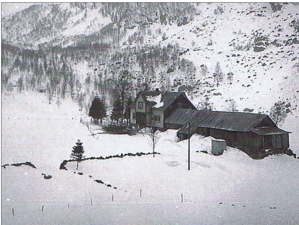
Garden Grøtteland vinteren 1946/47. Heimehuset og fjøset har nå fått takpanner isteden for torvtak, og et påbygg med kvist over det gamle inngangspartiet, ellers slik den var under krigen.