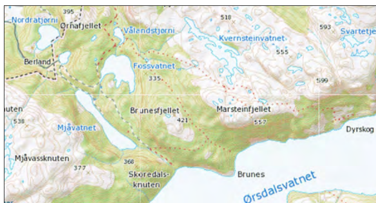
Brunnesdalen går mellom Brunesfjellet og Marsteinfjellet, vi ser garden Dyrskog helt til høyre på kartet.