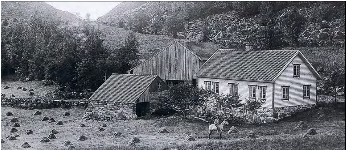
Gården til Inga og Jonas Vaule under krigen. Sønnen Sigurd overtok gården i 1946, og heimehuset fekk en ny 2. etasje i 1948. Ny driftsbygning ble oppført i 1952.