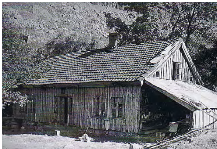
Huset i Dyrskog slik det stod i 1944.