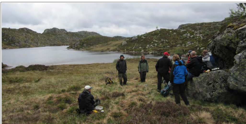
Her ved steinen til høgre stod hytta. Nå er bare noen plater av ovnen att på staden.

I natt hev det snøa ein del. Det ser ikkje ut til eg fær taka iver dei fyrste dagene, veiret er så ustadig. Eg treng 2 dager på turen og vegen går yver dei høgaste heiane og no er det ein heil del snø, så eg vågar meg ikkje iver fyr veret vert stadig. Det er ei pine å liggja her å vente.