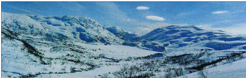
Det vart lange ensomme dager på disse fjellviddene i 700-800 meters høyde

Søndag. Det har snøa og blese heile natta og endå held det på. Snøen ligg i store fenner over alt. Rjupone kom like heim til hytta i dag, og gjekk og pikka og åt i noko bjørkeris eg hadde lagt ned atmed vegg. Det dreiv og snøa så dei sansa kje meg om eg stod i døra, ikkje meir enn 2 m. ifrå dei. Klokka 2. Snødrevet har lagt seg. No regner det så smått og dryp av taket. Eg skulle ynskja at regnet ville halda på ei stund, sa noko av all denne snøen ville tina burt. Det er felt å gå å vassa i så mykje snø, så tidleg på vinteren. Har ikkje kome utfor døra til nokon ting heile dagen. Lange dagar