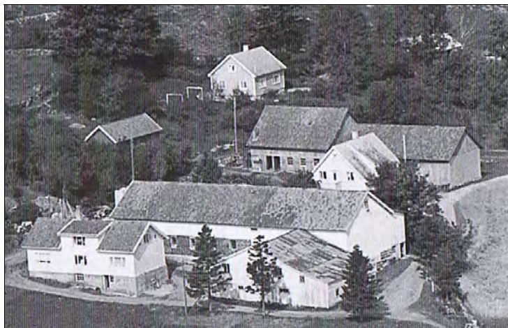
Helt bakerst lite synlig mellom trea ligger gården til Per og Benny Tysland.

En del bilder, en del penger og mange småting. Det var ikke så svært lenge vi kunne sitte i ro for det begynte å bli kaldt, våte og svette og med så lite klær som vi var. Vi smøg oss nu fra stein til stein og fra knatte til knatte til vi kom i nærheten av gården x. (Tysland) Der la vi oss til mellom noen store steiner ca 400 m. fra gården. Mens vi låg der og frøs, kom konen på gården (Benny) jagende med kyrene like forbi der vi låg.