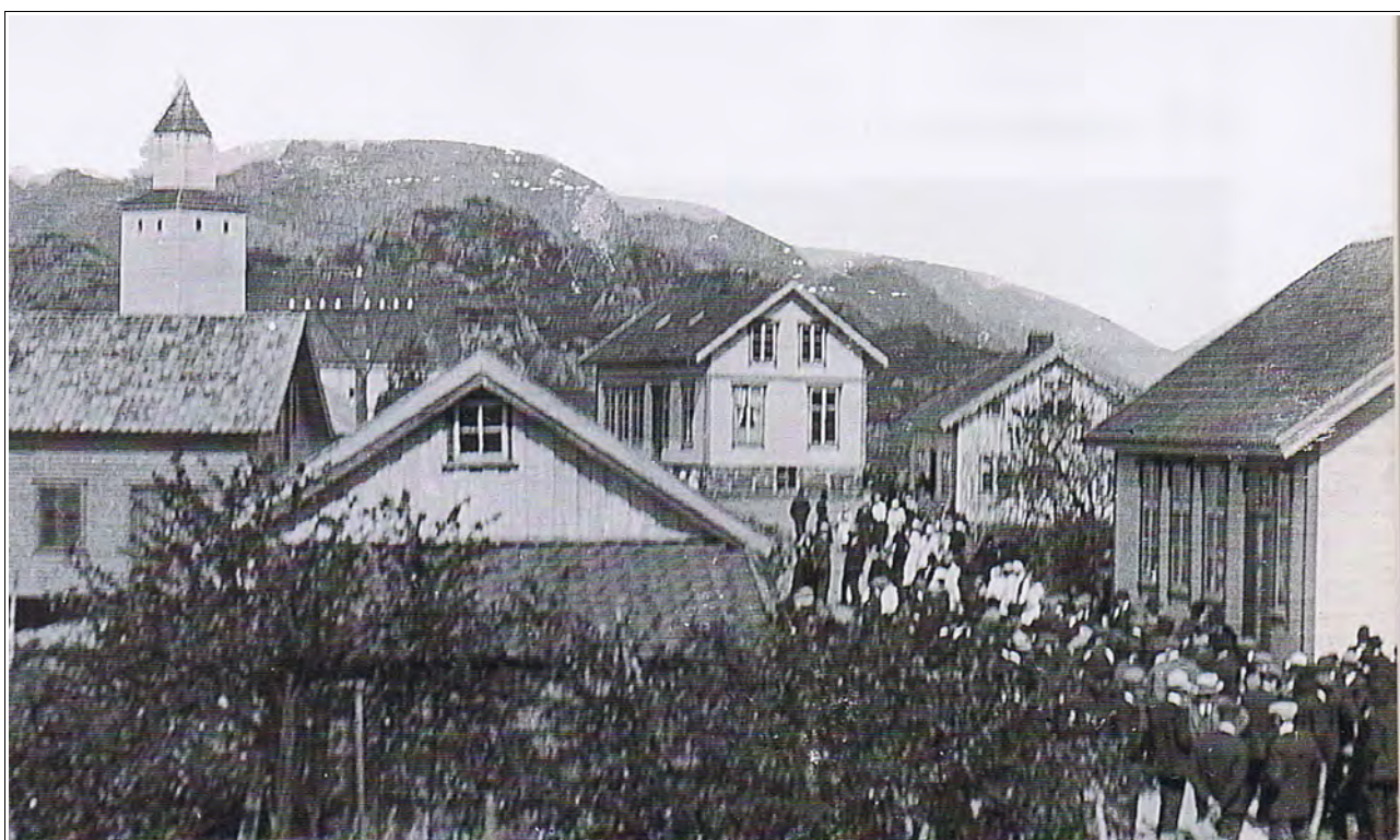
Ved utskiftningen i 1896 måtte tre gardbrukere flytte alle husa sine ut av det gamle klyngetunet. Det gamle skulehuset og uthuset måtte også flyttes. Kommunen nyttet da høvet til å bygge ny skule nærmere kyrkja. Vi ser den nye skulen midt i bilde. Foto: Tønnes Sandstøl, Egersund 1922.