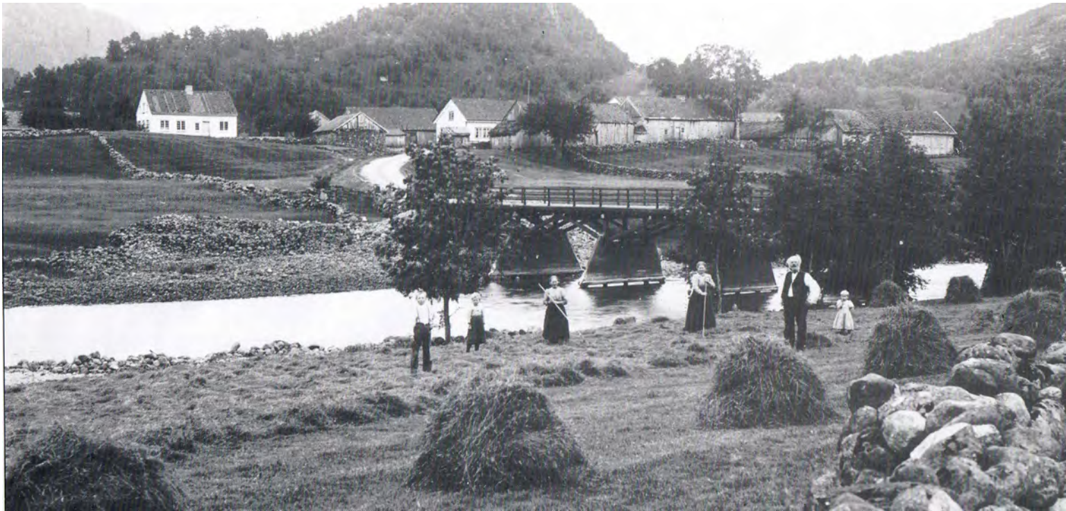
Bygningen heilt til venstre er den første faste skulen i Bjerkreim. Bildet er tatt 1896.

Frå 1838 og utetter vart det strid om plassering av fast skule. Lova forlangte at det skulle vera en fast skule i hvert prestegjeld, og en vart nøyd å få fast skule også i Helleland Prestegjeld. Men kor skulle skulen ligge. Da det såg ut for at det vart på Strømstad i Helleland at skulen skulle ligge, krevde Bjerkreim at soknene skulle ha kvar sitt skulevesen og at skulekassa skulle deles. Baktanken var sjølvsagt at Bjerkreim ville ikke vara med å bygga skulehus borte i Helleland.