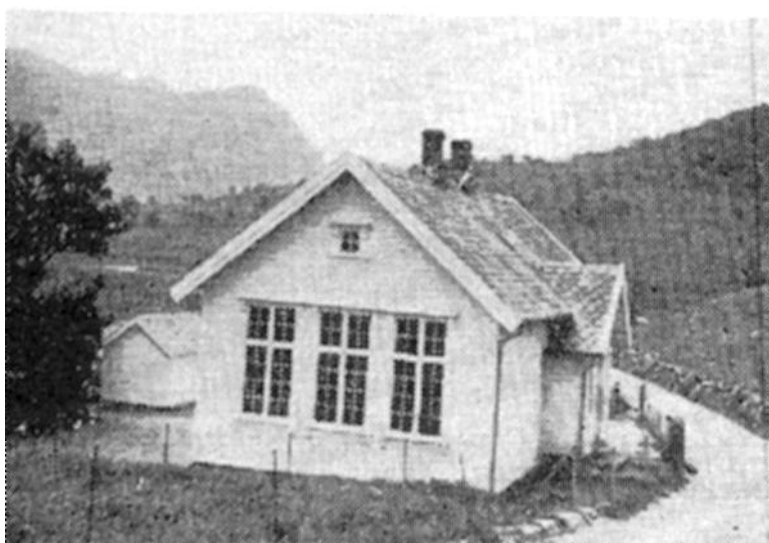
Bilete av skulehuset frå boka «Norges Bebyggelse». som vise enden der møtestova var. Sulestova i motsett ende hadde heilt like vindauge.

var det ganske ofte at skulen varde heilt til kl fire. I det lange friminuttet kunne skuleungane finna på å ga på Middagsknuten eller på ein annan langtur. Ein gong dei var i Storestein-hagen ( br 5, Eikeland), først på 1900-talet, og skulle henta sureple (blei søte når vi la dei i høy ei tid) så var ein av dei uheldig når han skulle klatra ned. Enten hadde han for stor fart, eller så datt han. I alle høve hengde overleppa seg fast i ein av dei mange kvistane og blei kløyvd. Det var vel ikkje snakk om lege eller syng, og merket hadde mannen all sin dag.