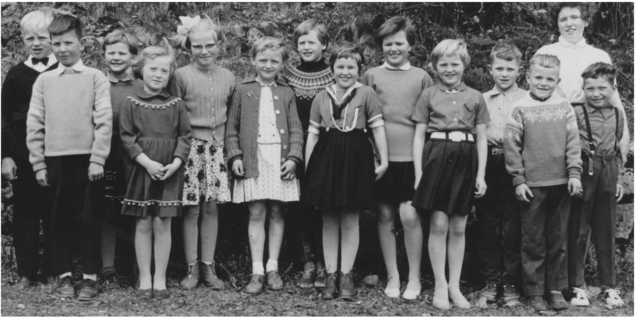
Småskulen på Røysland 1959-60