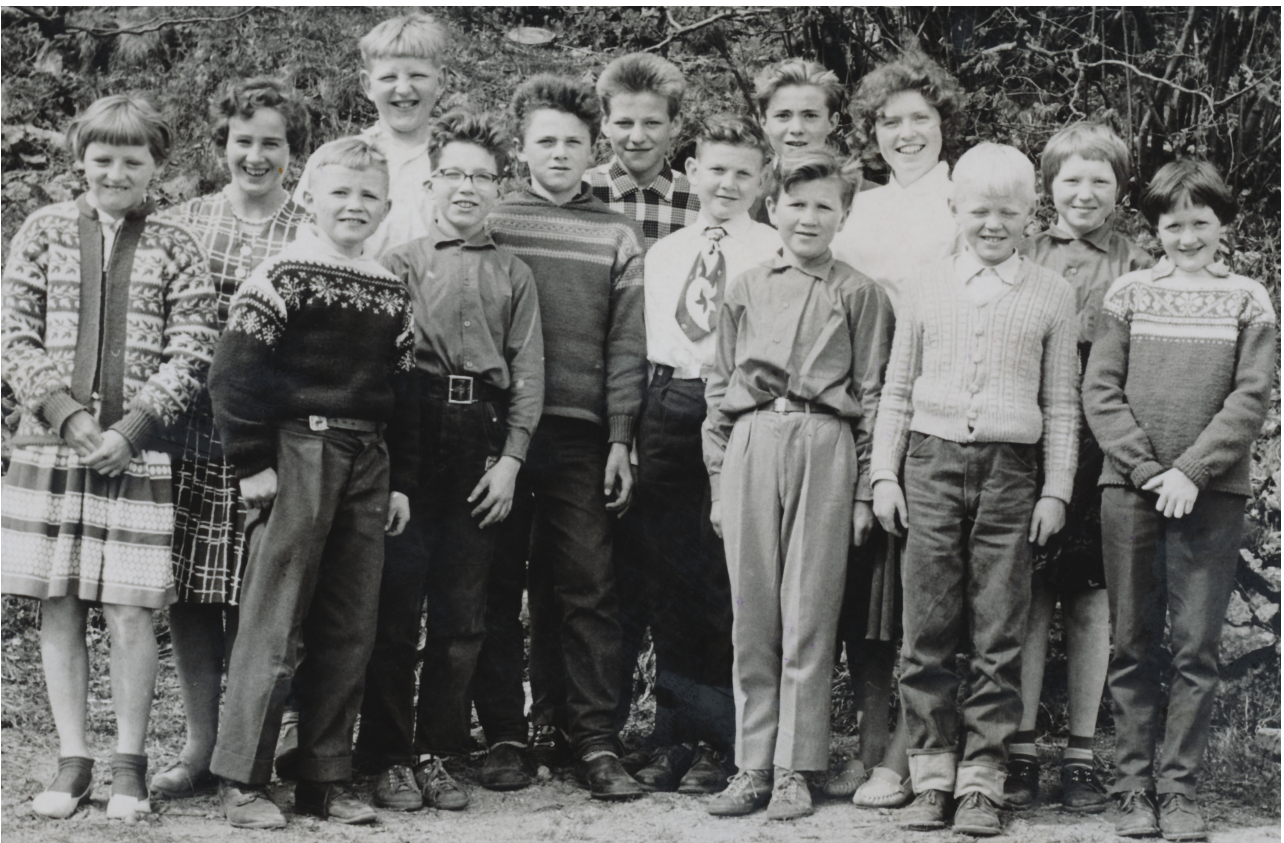
Storskulen på Røysland 1959 – 60