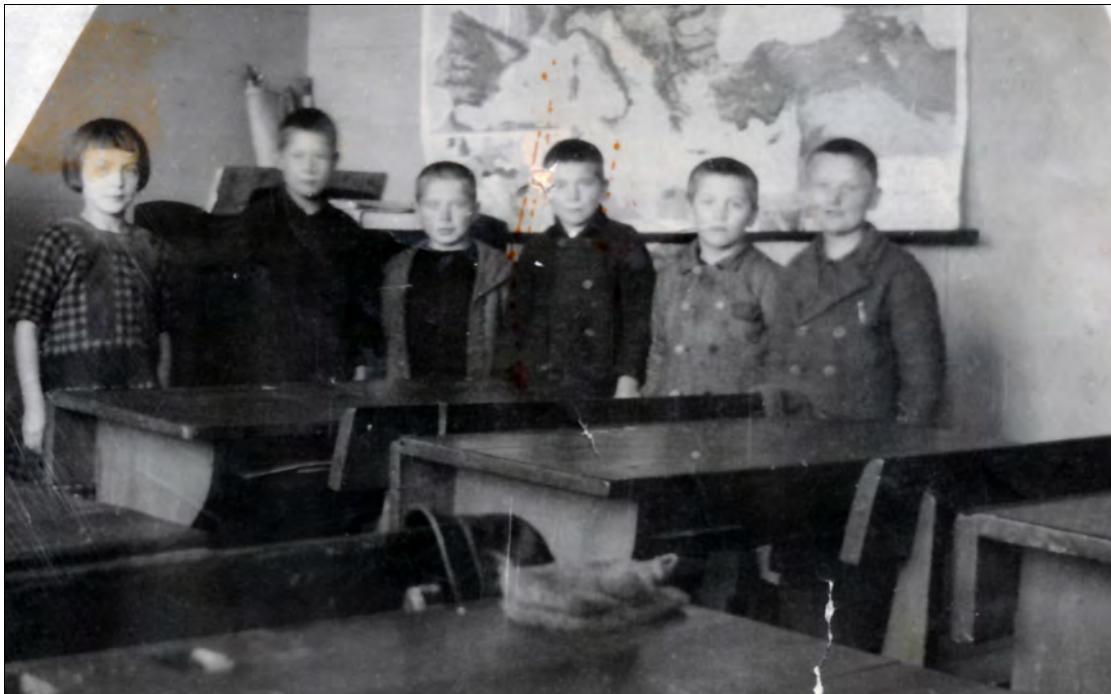
Frå skulestova på Røysland 1927/1928.