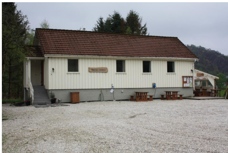
Tengesdal Grendahus SA.

I dag er skulehuset mykje påbygt og vel istandsett, og under stadig renovering. Det var lenge eit bedehus under Indremisjonen, men er overtatt av innbyggjarar i gamle Tengesdal skulekrins og nyttast som krinsen sitt grendahus og møtelokale.