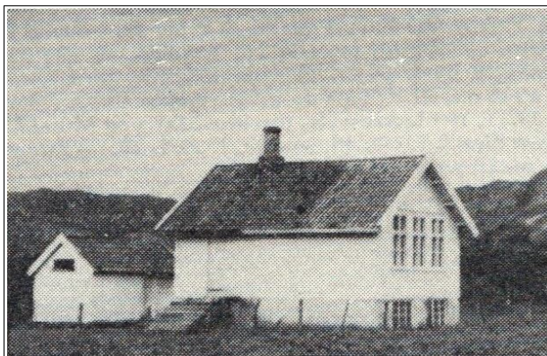
Skulebygningen omlag 1955. (Foto Norge bebyggelse).

Det var også eit uthus med vedskjul og lager for sløydmaterialer i den eine enden og utedo over ein betongkum i den andre enden. Her var det tre rom. Eit pissoar, og to do med dobbeltsete – eit jentedo og eit gutedo.