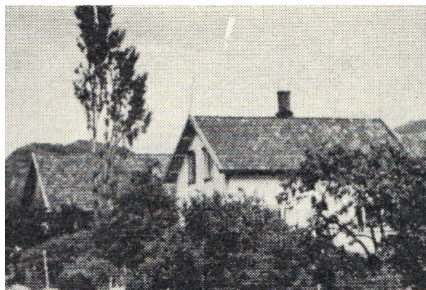
Lærarbustaden om lag 1955.