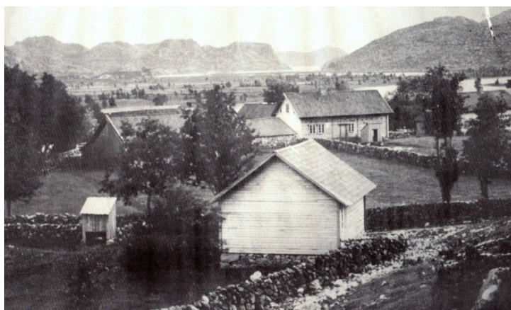
Tengesdal gamle skulehus ca. 1900. Det gamle klyngetunet i bakgrunnen. Utsiftinga var i 1902. Truleg fotografert før lærarbustad vart bygd innåt.

Huset vart bygt under Litlhaug. Det var eit heller lite hus. Seinare vart det bygd ein lærarbustad innåt.